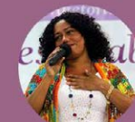
Carmem Foro Vice-Presidente Nacional da CUT