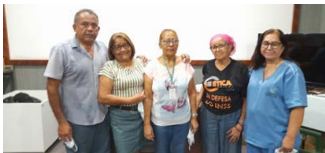
Assembleia com filias do Hospital de Messejana, 22/06