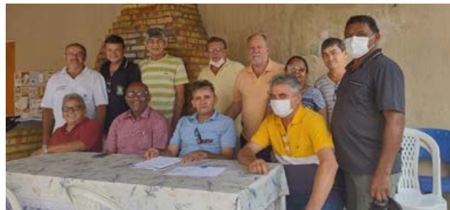
Assembleia com filiados do Ministério da Saúde de Quixaramobim, hoje, 24/06

Confira as imagens das últimas assembleias