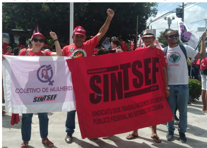
Direção Colegiada do Sintsef-CE participando do ato em Fortaleza