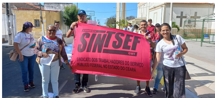
Coordenação e filiada da DS Centro-Sul no ato em Iguatu

Na manhã do último dia 07/09 o Sintsef-CE, participou tanto em Fortaleza, como no município de Iguatu, da 29ª edição do Grito dos Excluídos, que reúne diversos grupos sociais, ONG's, sindicatos e comunidades para protestar contra diversas formas de exclusão, injustiça social, desigualdades e violações de direitos.